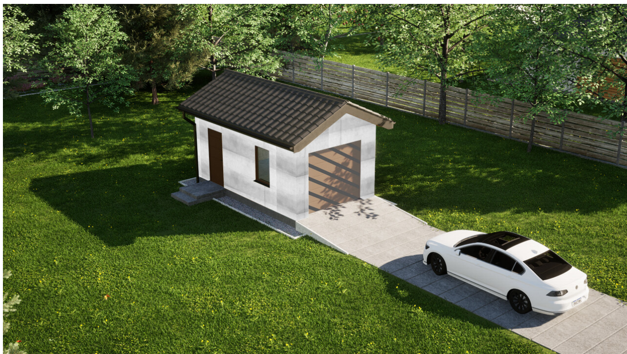
Garaz ERDOL G1 - Wersja lewa - Układ kalenicy prostopadły z dachem dwuspadowym o kącie nachylenia 25 stopni - Bez bramy - Złoty dąb