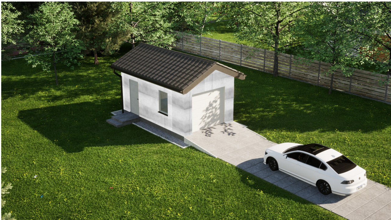
Garaz ERDOL G1 - Wersja lewa - Układ kalenicy prostopadły z dachem dwuspadowym o kącie nachylenia 25 stopni - Brama segmentowa z napędem IO, sterowana pilotem - UniPro WISNIOWSKI - Białe