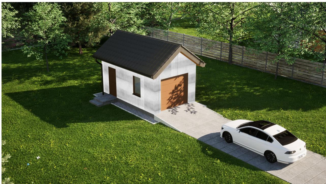
Garaz ERDOL G1 - Wersja lewa - Układ kalenicy prostokątnej z dachem dwuspadowym o kącie nachylenia 35 stopni - Brama segmentowa z napędem IO, sterowana pilotem - UniPro WISNIEWSKI - Złoty dąb