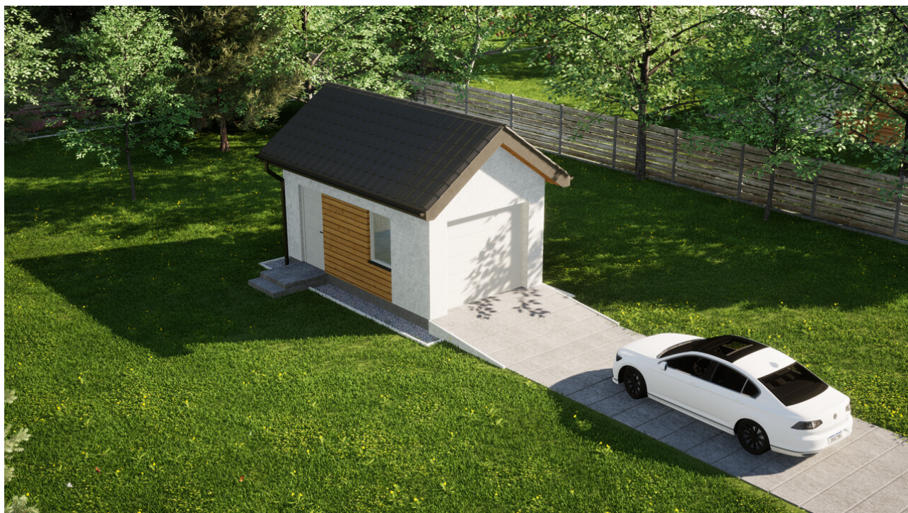
Garaz ERDOL G1 - Wersja lewa - Układ kalenicy prostokątny z dachem dwuspadowym o kącie nachylenia 35 stopni - Brama segmentowa z napędem IO, sterowana pilotem - UniPro WISNIOWSKI - Białe