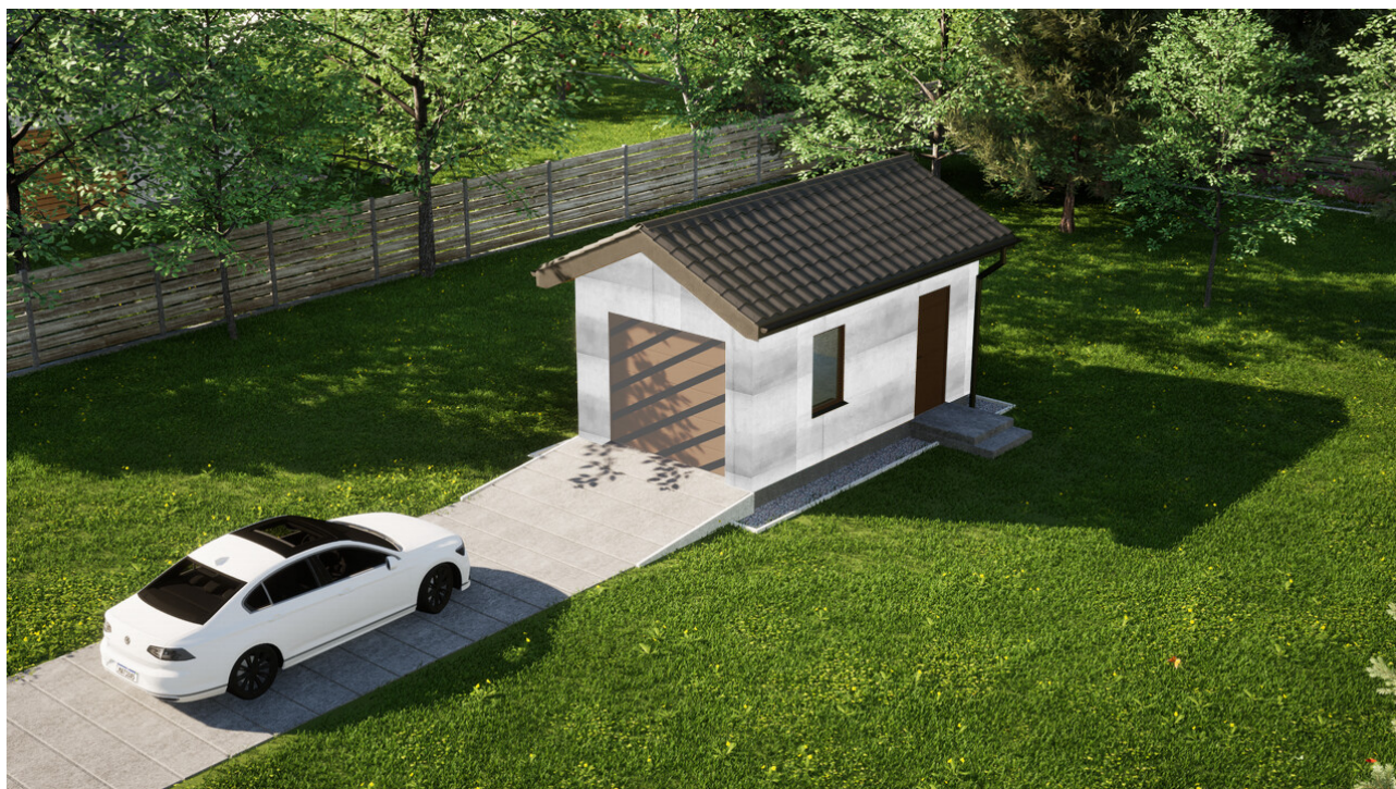
Garaz ERDOL G1 - Wersja prawa - Układ kalenicy prostopadły z dachem dwuspadowym o kącie nachylenia 25 stopni - Bez bramy - Żółty dąb