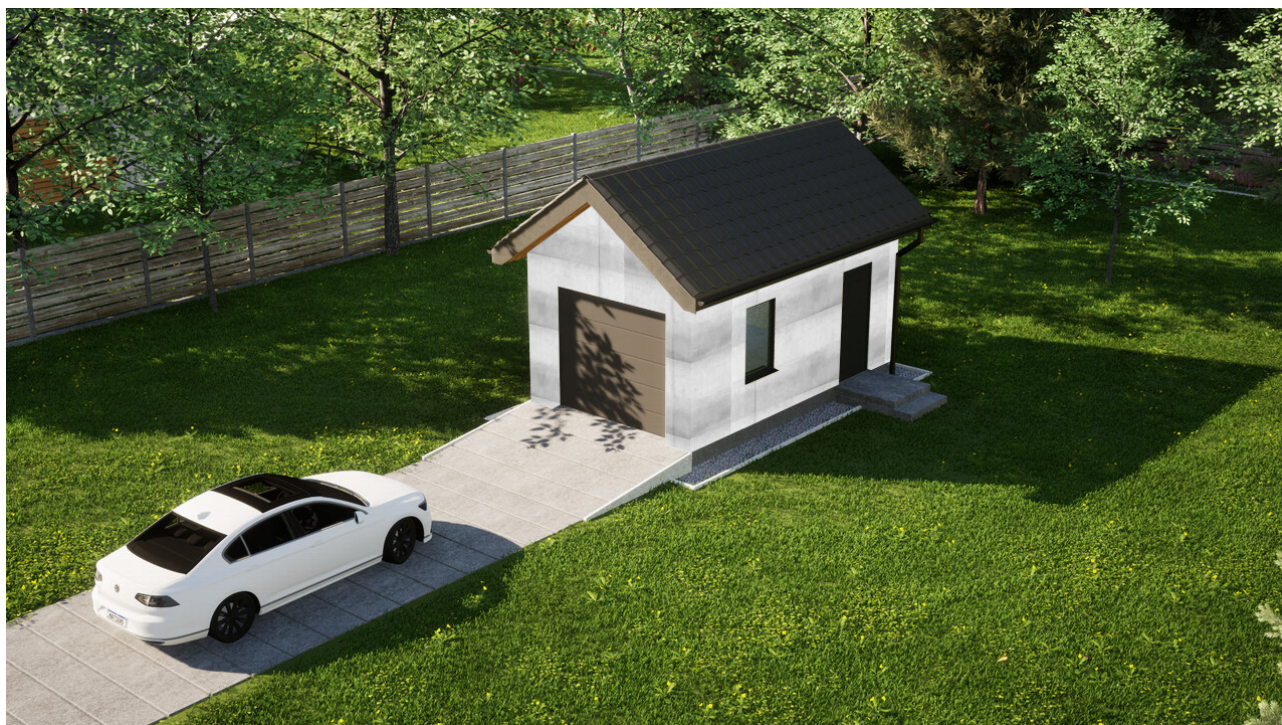
Garaż ERDOL G1 - Wersja prawa - Układ kalenicy prostopadły z dachem dwuspadowym o kącie nachylenia 35 stopni - Brama segmentowa z napędem IO, sterowana pilotem - UniPro WIŚNIEWSKI - Antracyt