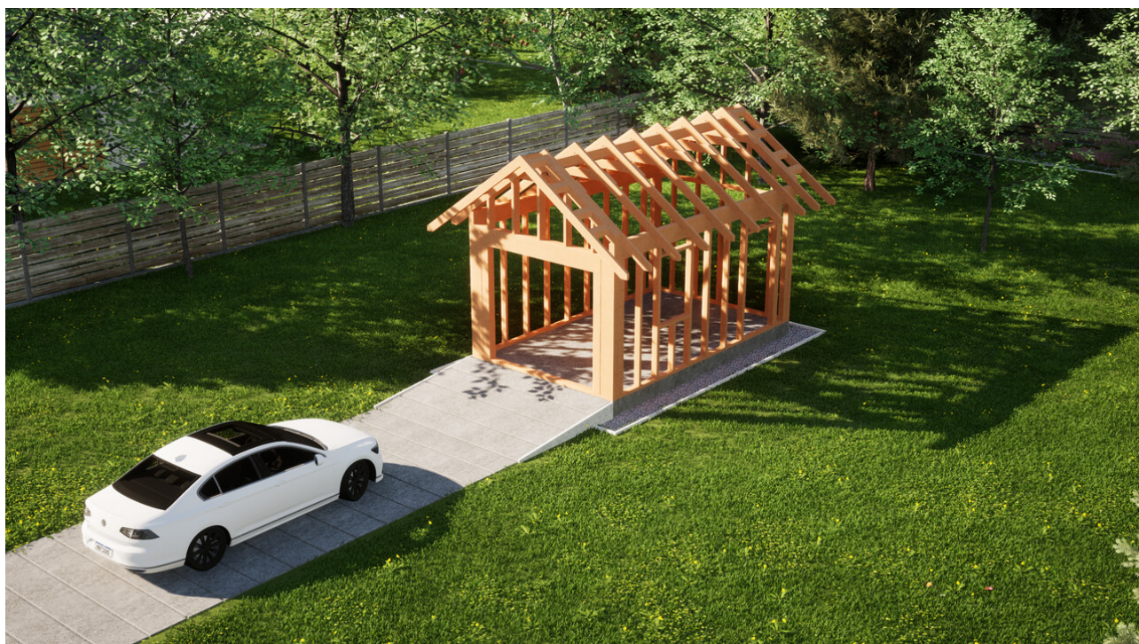
Widok konstrukcji: Garaż ERDOL G1 - Wersja prawa - Układ kalenicy prostopadły z dachem dwuspadowym o kącie nachylenia 35 stopni

Przedstawiona oferta ma charakter informacyjny i nie stanowi oferty handlowej w rozumieniu Art. 66 par. 1 Kodeksu Cywilnego oraz innych przepisów prawnych. Zamieszczone wizualizacje mają charakter poglądowy i nie mogą być traktowane jako ostateczne projekty realizacyjne.