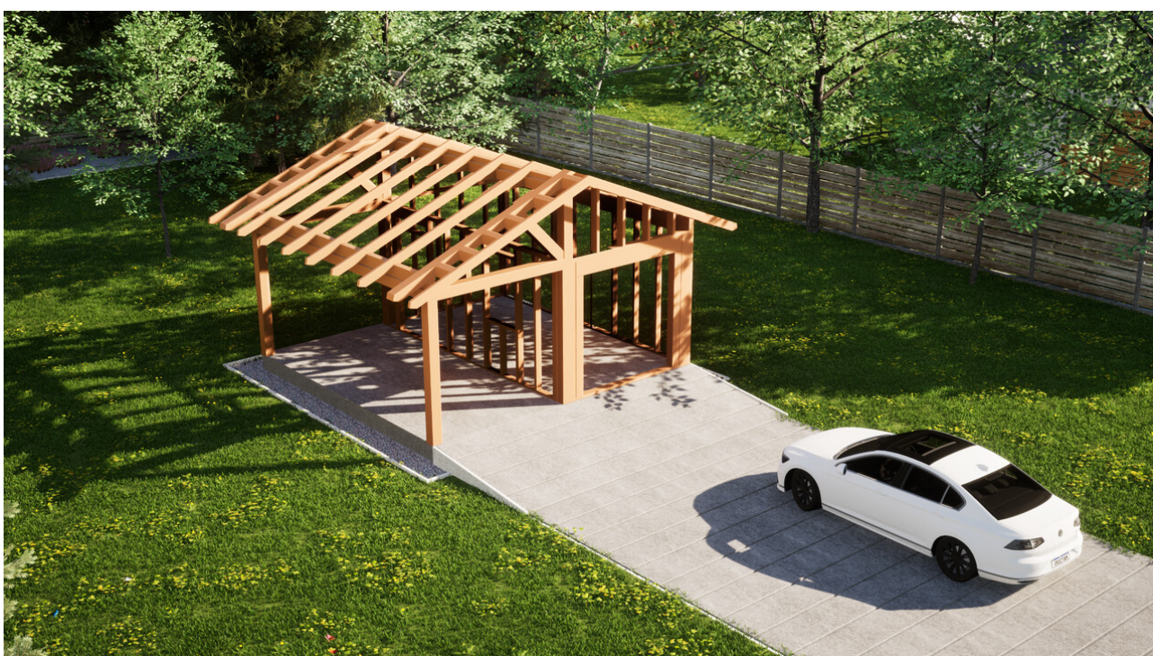
Widok konstrukcji: Garaz ERDOL G1W - Wersja lewa - Układ kalenicy prostopadły z dachem dwuspadowym o kącie nachylenia 25 stopni

Przedstawiona oferta ma charakter informacyjny i nie stanowi oferty handlowej w rozumieniu Art. 66 par. 1 Kodeksu Cywilnego oraz innych przepisów prawnych. Zamieszczone wizualizacje mają charakter poglądowy i nie mogą być traktowane jako ostateczne projekty realizacyjne.