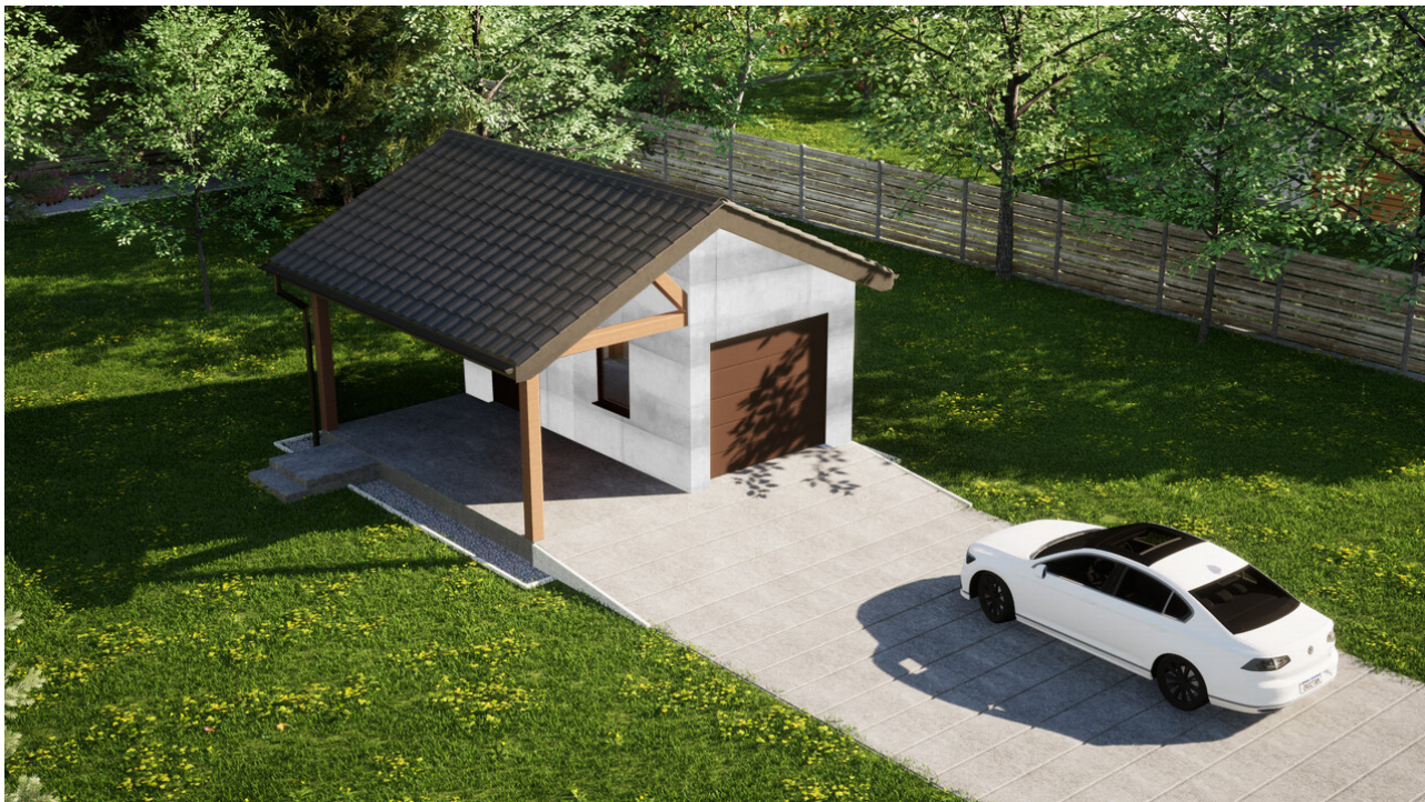
Garaz ERDOL G1W - Wersja lewa - Układ kalenicy prostopadły z dachem dwuspadowym o kącie nachylenia 25 stopni - Brama segmentowa z napędem IO, sterowana pilotem - UniPro WIŚNIEWSKI - Orzech