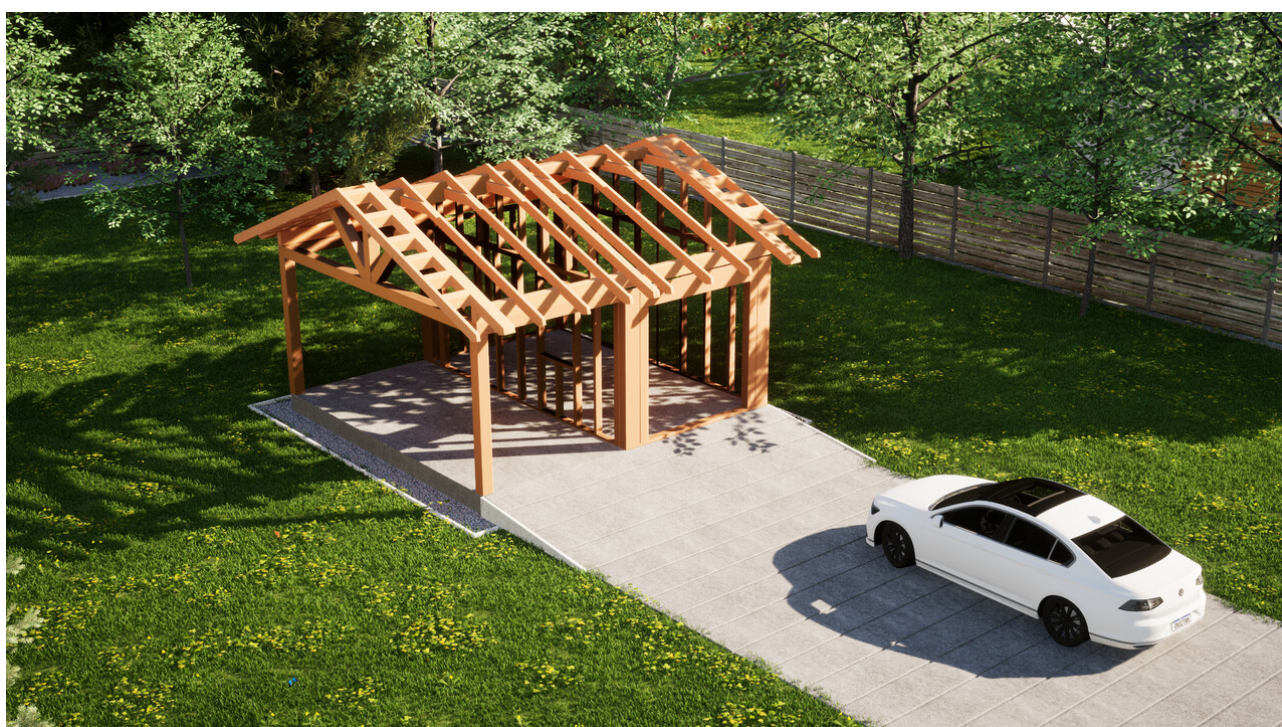
Widok konstrukcji: Garaz ERDOL G1W - Wersja lewa - Układ kalenicy równoległy z dachem dwuspadowym o kącie nachylenia 25 stopni

Przedstawiona oferta ma charakter informacyjny i nie stanowi oferty handlowej w rozumieniu Art. 66 par. 1 Kodeksu Cywilnego oraz innych przepisów prawnych. Zamieszczone wizualizacje mają charakter poglądowy i nie mogą być traktowane jako ostateczne projekty realizacyjne.