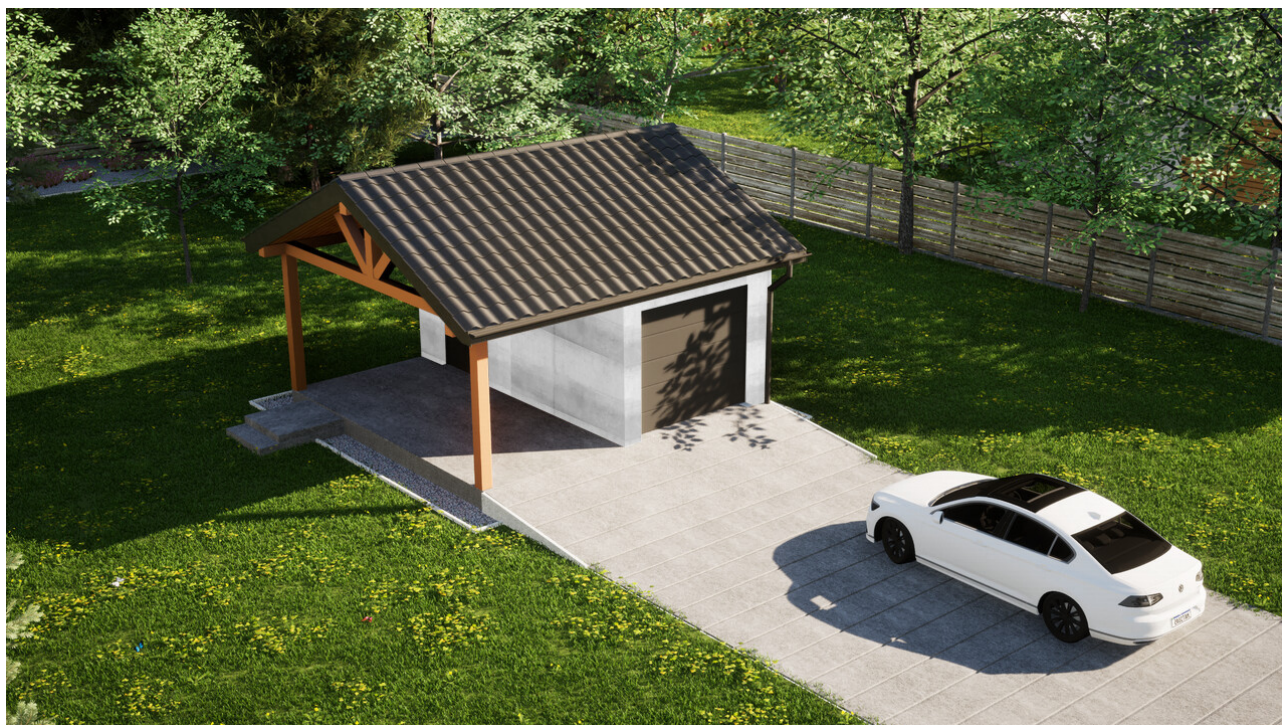
Garaz ERDOL G1W - Wersja lewa - Układ kalenicy równoległy z dachem dwuspadowym o kącie nachylenia 25 stopni - Brama segmentowa z napędem IO, sterowana pilotem - UniPro WISNIEWSKI - Antracyt