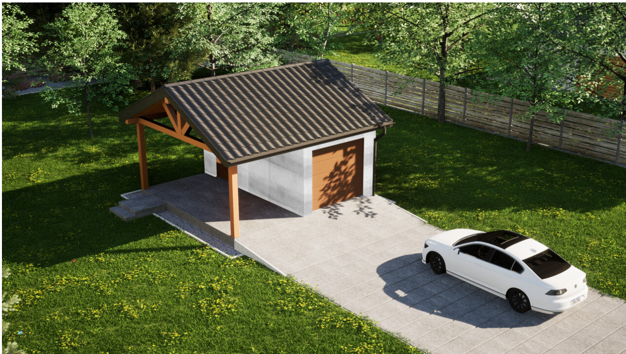
Garaz ERDOL G1W - Wersja lewa - Układ kalenicy równoległy z dachem dwuspadowym o kącie nachylenia 25 stopni - Brama segmentowa z napędem IO, sterowana pilotem - UniPro WISNIEWSKI - Złoty dąb