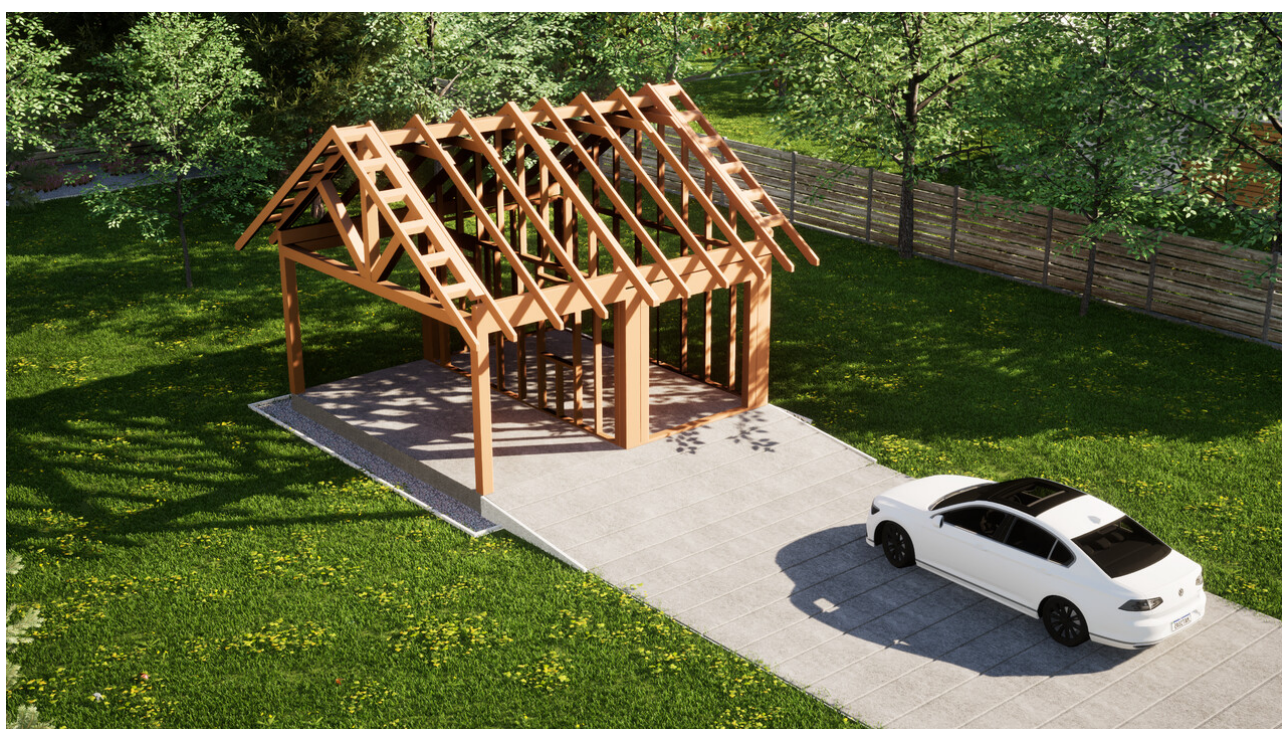
Widok konstrukcji: Garaz ERDOL G1W - Wersja lewa - Układ kalenicy równoległy z dachem dwuspadowym o kącie nachylenia 35 stopni

Przedstawiona oferta ma charakter informacyjny i nie stanowi oferty handlowej w rozumieniu Art. 66 par. 1 Kodeksu Cywilnego oraz innych przepisów prawnych. Zamieszczone wizualizacje mają charakter poglądowy i nie mogą być traktowane jako ostateczne projekty realizacyjne.