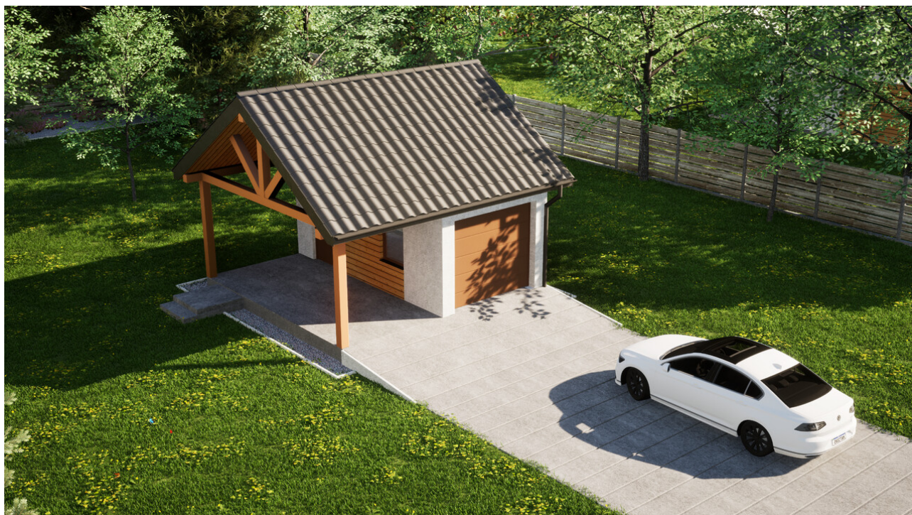
Garaz ERDOL G1W - Wersja lewa - Układ kalenicy równoległy z dachem dwuspadowym o kącie nachylenia 35 stopni - Brama segmentowa z napędem IO, sterowana pilotem - UniPro WISNIEWSKI - Złoty dąb