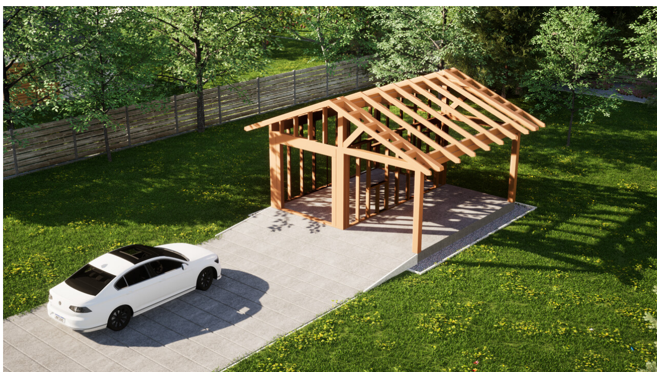
Widok konstrukcji: Garaż ERDOL G1W - Wersja prawa - Układ kalenicy prostopadły z dachem dwuspadowym o kącie nachylenia 25 stopni