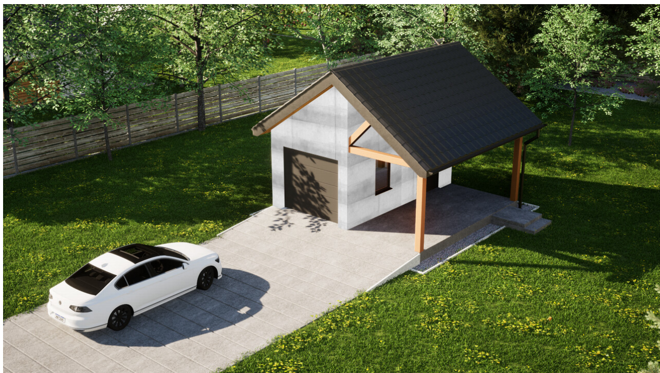
Garaż ERDOL G1W - Wersja prawa - Układ kalenicy prostopadły z dachem dwuspadowym o kącie nachylenia 35 stopni - Brama segmentowa z napędem IO, sterowana pilotem - UniPro WIŚNIEWSKI - Antracyt