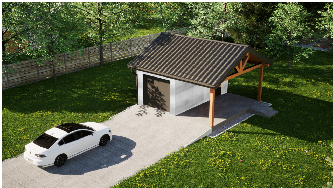
Garaz ERDOL G1W - Wersja prawa - Układ kalenicy równoległy z dachem dwuspadowym o kącie nachylenia 25 stopni - Brama segmentowa z napędem IO, sterowana pilotem - UniPro WIŚNIEWSKI - Antracyt