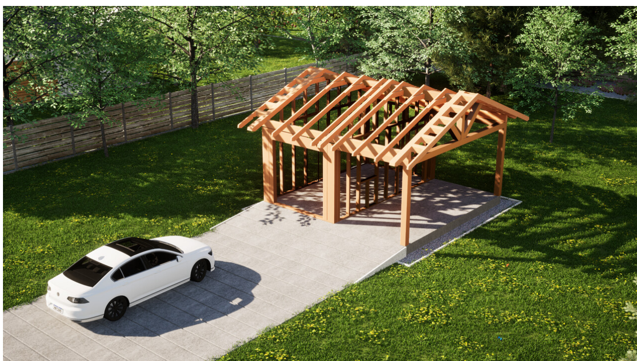
Widok konstrukcji: Garaż ERDOL G1W - Wersja prawa - Układ kalenicy równoległy z dachem dwuspadowym o kącie nachylenia 25 stopni