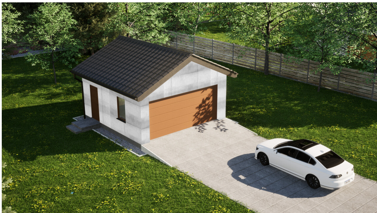
Garaz ERDOL G2 - Wersja lewa - Układ kalenicy prostopadły z dachem dwuspadowym o kącie nachylenia 25 stopni - Brama segmentowa z napędem IO, sterowana pilotem - UniPro WISNIEWSKI - Złoty dąb