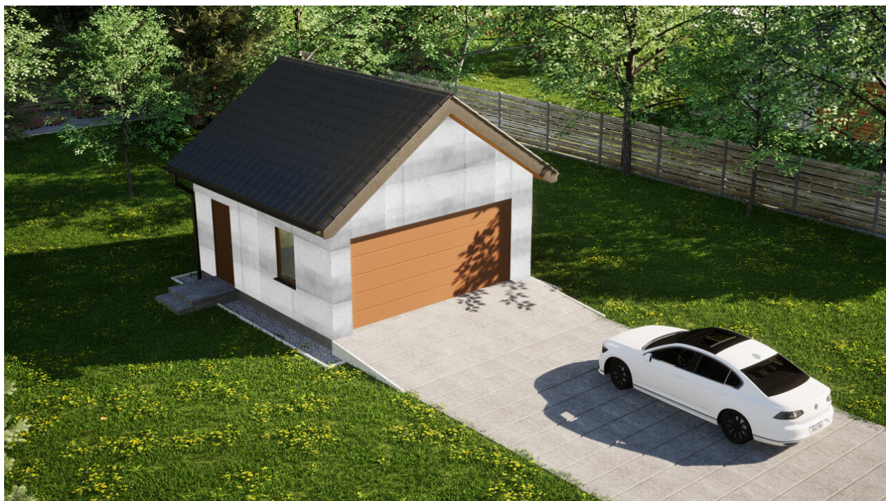
Garaz ERDOL G2 - Wersja lewa - Układ kalenicy prostopadły z dachem dwuspadowym o kącie nachylenia 35 stopni - Brama segmentowa z napędem IO, sterowana pilotem - UniPro WISNIOWSKI - Złoty dąb