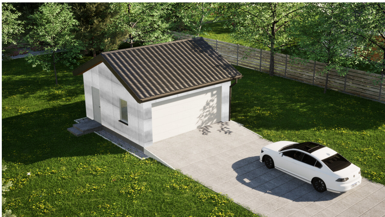
Garaz ERDOL G2 - Wersja lewa - Układ kalenicy równoległy z dachem dwuspadowym o kącie nachylenia 25 stopni - Brama segmentowa z napędem IO, sterowana pilotem - UniPro WISNIOWSKI - Białe