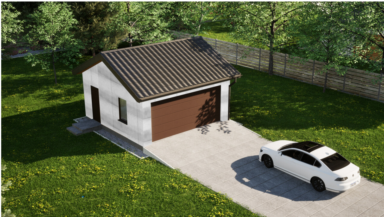
Garaz ERDOL G2 - Wersja lewa - Układ kalenicy równoległy z dachem dwuspadowym o kącie nachylenia 25 stopni - Brama segmentowa z napędem IO, sterowana pilotem - UniPro WISNIOWSKI - Orzech