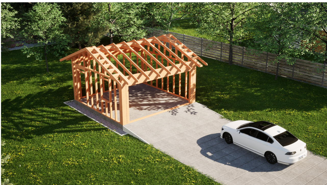
Widok konstrukcji: Garaz ERDOL G2 - Wersja lewa - Układ kalenicy równoległy z dachem dwuspadowym o kącie nachylenia 25 stopni

Przedstawiona oferta ma charakter informacyjny i nie stanowi oferty handlowej w rozumieniu Art. 66 par. 1 Kodeksu Cywilnego oraz innych przepisów prawnych. Zamieszczone wizualizacje mają charakter poglądowy i nie mogą być traktowane jako ostateczne projekty realizacyjne.