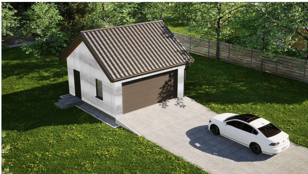
Garaz ERDOL G2 - Wersja lewa - Układ kalenicy równoległy z dachem dwuspadowym o kącie nachylenia 35 stopni - Brama segmentowa z napędem IO, sterowana pilotem - UniPro WISNIOWSKI - Antracyt