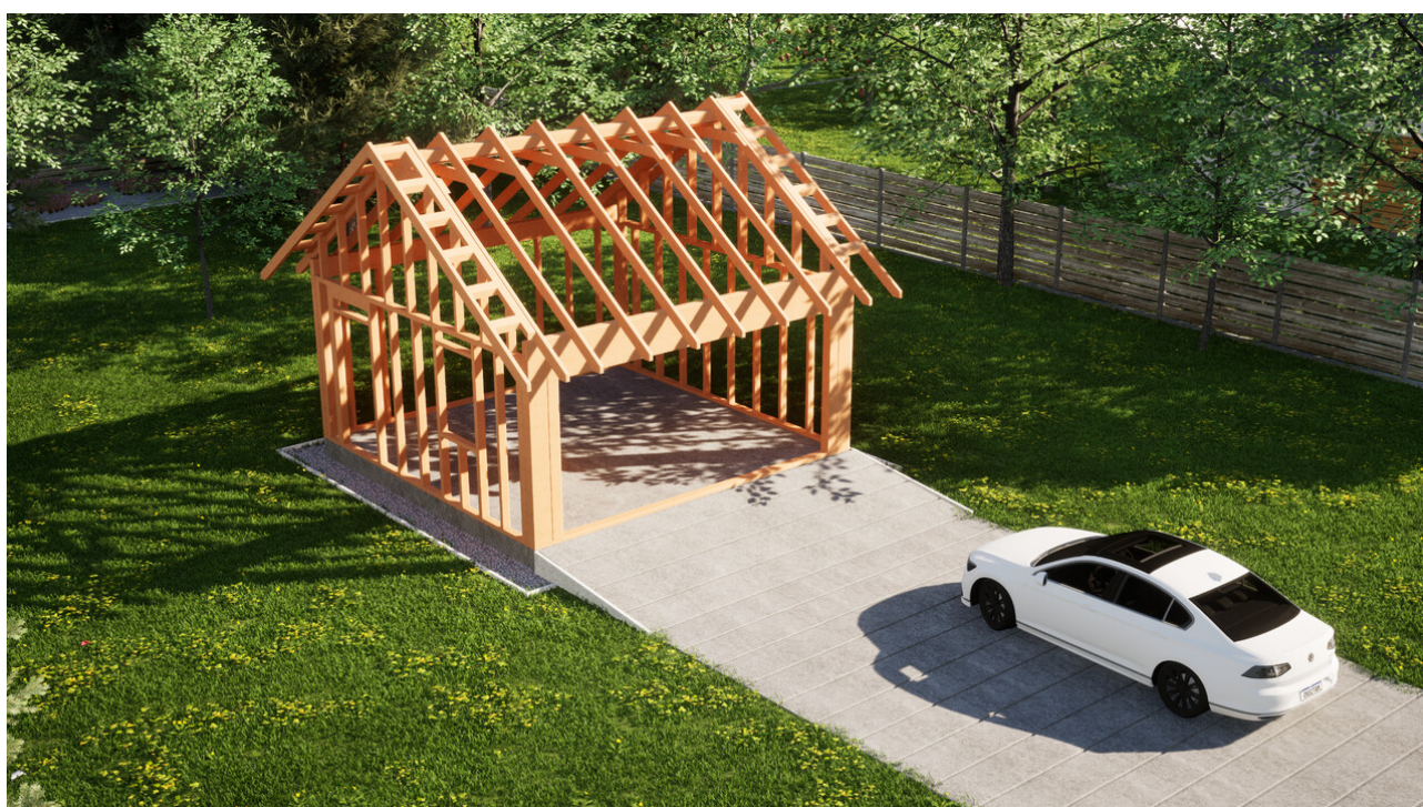
Widok konstrukcji: Garaz ERDOL G2 - Wersja lewa - Układ kalenicy równoległy z dachem dwuspadowym o kącie nachylenia 35 stopni

Przedstawiona oferta ma charakter informacyjny i nie stanowi oferty handlowej w rozumieniu Art. 66 par. 1 Kodeksu Cywilnego oraz innych przepisów prawnych. Zamieszczone wizualizacje mają charakter poglądowy i nie mogą być traktowane jako ostateczne projekty realizacyjne.