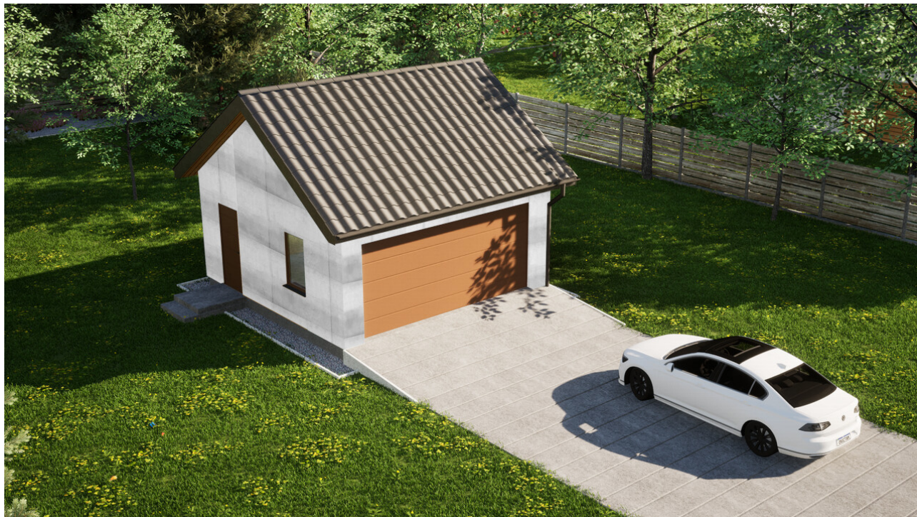
Garaz ERDOL G2 - Wersja lewa - Układ kalenicy równoległy z dachem dwuspadowym o kącie nachylenia 35 stopni - Brama segmentowa z napędem IO, sterowana pilotem - UniPro WIŚNIEWSKI - Złoty dąb