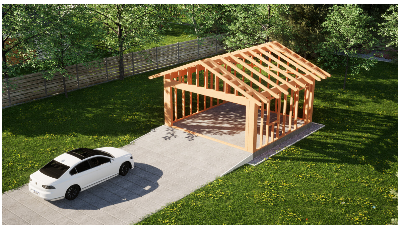
Widok konstrukcji: Garaż ERDOL G2 - Wersja prawa - Układ kalenicy prostopadły z dachem dwuspadowym o kącie nachylenia 25 stopni

Przedstawiona oferta ma charakter informacyjny i nie stanowi oferty handlowej w rozumieniu Art. 66 par. 1 Kodeksu Cywilnego oraz innych przepisów prawnych. Zamieszczone wizualizacje mają charakter poglądowy i nie mogą być traktowane jako ostateczne projekty realizacyjne.