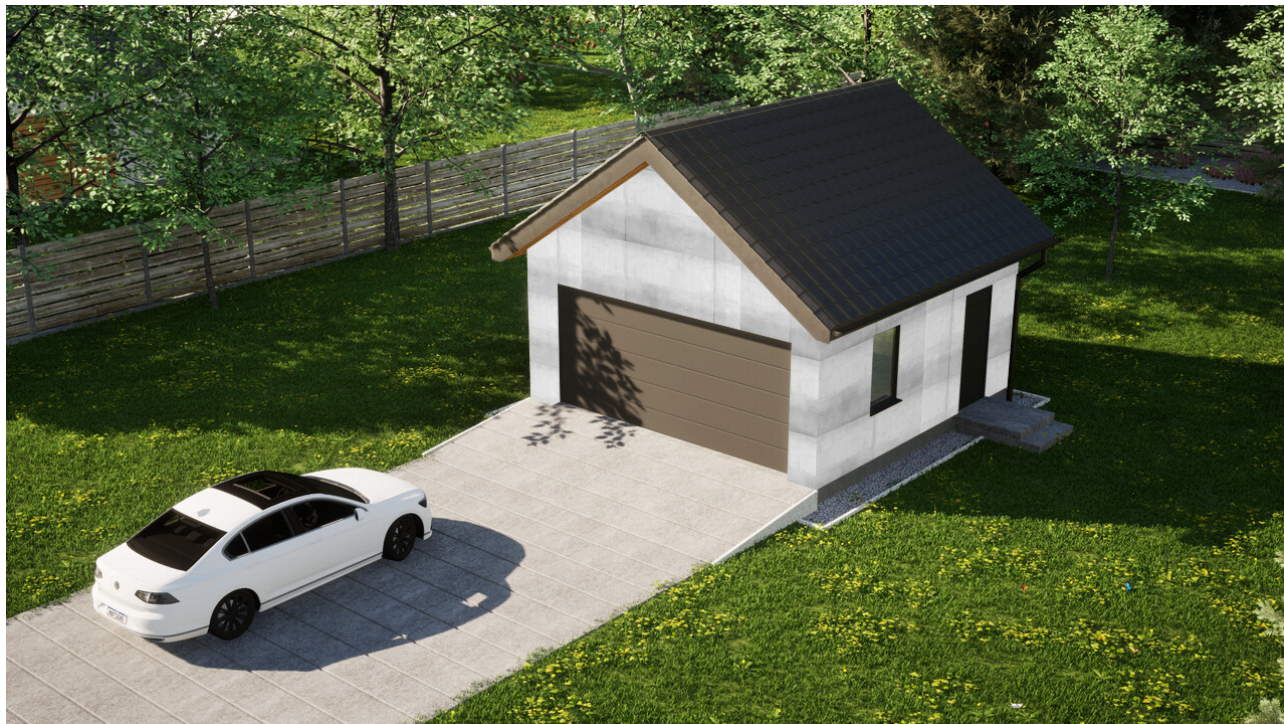
Garaż ERDOL G2 - Wersja prawa - Układ kalenicy prostopadły z dachem dwuspadowym o kącie nachylenia 35 stopni - Brama segmentowa z napędem IO, sterowana pilotem - UniPro WIŚNIEWSKI - Antracyt