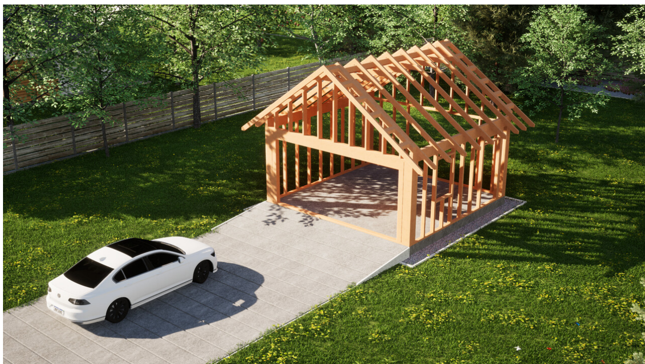
Widok konstrukcji: Garaż ERDOL G2 - Wersja prawa - Układ kalenicy prostopadły z dachem dwuspadowym o kącie nachylenia 35 stopni

Przedstawiona oferta ma charakter informacyjny i nie stanowi oferty handlowej w rozumieniu Art. 66 par. 1 Kodeksu Cywilnego oraz innych przepisów prawnych. Zamieszczone wizualizacje mają charakter poglądowy i nie mogą być traktowane jako ostateczne projekty realizacyjne.