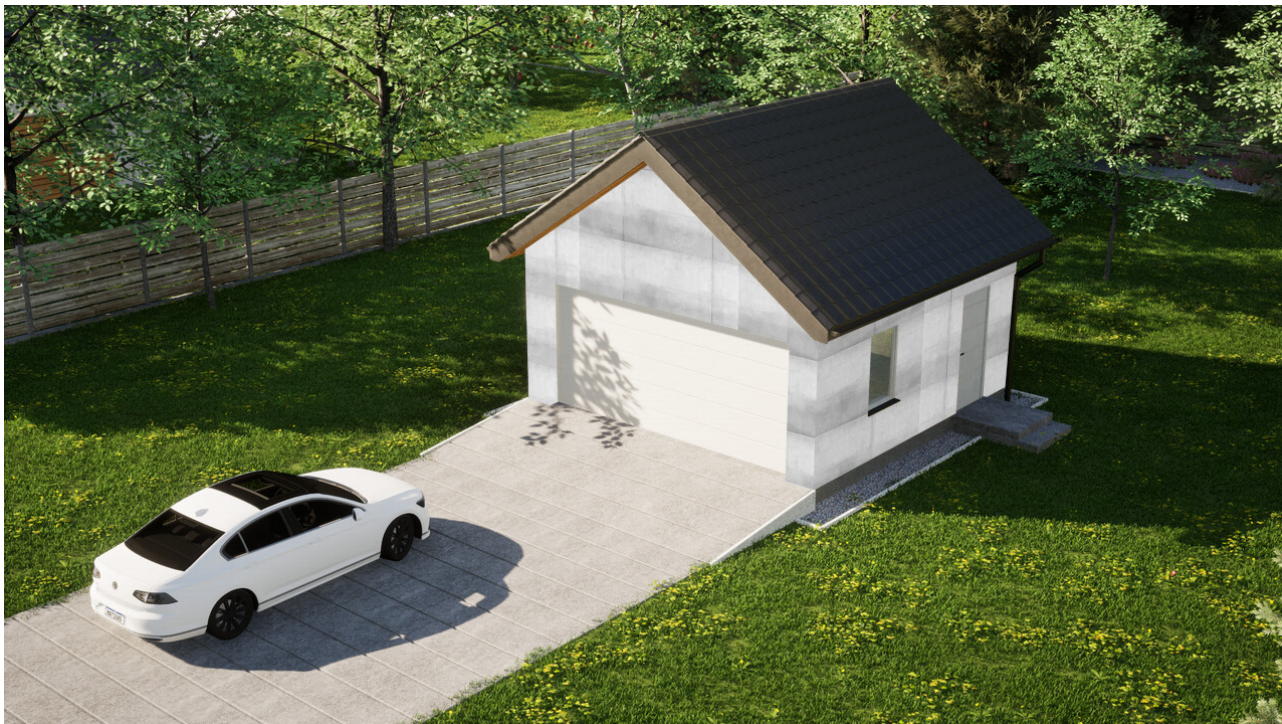
Garaż ERDOL G2 - Wersja prawa - Układ kalenicy prostopadły z dachem dwuspadowym o kącie nachylenia 35 stopni - Brama segmentowa z napędem IO, sterowana pilotem - UniPro WIŚNIEWSKI - Białe