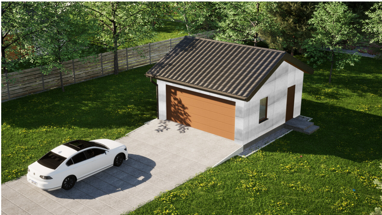
Garaz ERDOL G2 - Wersja prawa - Układ kalenicy równoległy z dachem dwuspadowym o kącie nachylenia 25 stopni - Brama segmentowa z napędem IO, sterowana pilotem - UniPro WISNIEWSKI - Złoty dąb